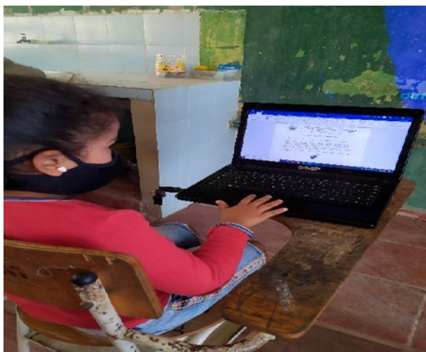
Fig.2. Realización Prueba Post test.

Su principal función es evaluar, mediante una prueba pos test, el aprendizaje de los estudiantes del grado quinto de la Institución Educativa San Juan del Chorrillo, (Chinú-Córdoba) Colombia, el impacto del uso del sistema pedagógico OVA que permite el desarrollo del aprendizaje, sobre la resolución de operaciones básicas con fraccionarios.