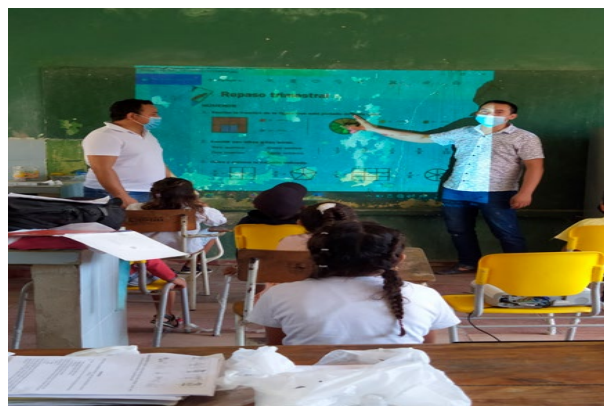
Fig.1. Prueba piloto mediante OVA

El objetivo de esta fase es la implementar de la estrategia didáctica para potenciar el aprendizaje de las operaciones matemáticas básicas con fraccionarios, en los estudiantes del grado quinto de la Institución Educativa San Juan del Chorrillo, (Chinú-Córdoba) Colombia, para ello se establecieron muchas actividades tales como la realización de prueba piloto mediante OVA con cuatro estudiantes realizando los ajustes necesarios.