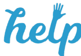
Figura 15. Home – Fundación Help.

Esta plataforma es una idea de Bancolombia, tiene como particularidad que está enfocada en estudiantes que, debido a diferentes situaciones, necesitan recursos económicos para terminar sus estudios. Hasta el momento este servicio ha logrado recaudar 72 millones de pesos con el apoyo de más de 750 personas en el país.