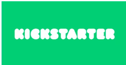
Figura 6. Kickstarter

desde cualquier parte del mundo, pues sus usuarios se cuentan por millones. Puede acceder a su versión en español y comprobar la variedad de iniciativas emprendedoras que están activas.