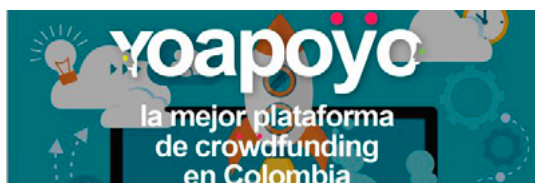
Figura 13. yoapoyo la mejor plataforma crowdfunding en Colombia

Este sitio apoya el financiamiento de proyectos de emprendimiento con énfasis artístico, intenciones sociales y personales para que se hagan realidad. Prioriza la consecución de la meta de cada proyecto antes que los beneficios económicos que se obtengan de esta actividad. Si una persona no alcanza a recaudar el total que tenía como objetivo, la plataforma le permite quedarse con el dinero que obtuvo para que siga intentando. [16]