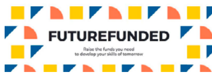
Figura 7. Futurefunded

Es una de las novedades más significativas del Crowdfunding, está centrada en el impulso del emprendimiento femenino en el sector TIC, una de las prioridades de la Sociedad Digital y en el que aún queda camino por recorrer. Esta iniciativa nació a finales de 2017 y en ella podemos encontrar un buen número de proyectos encabezados por emprendedoras. [10]