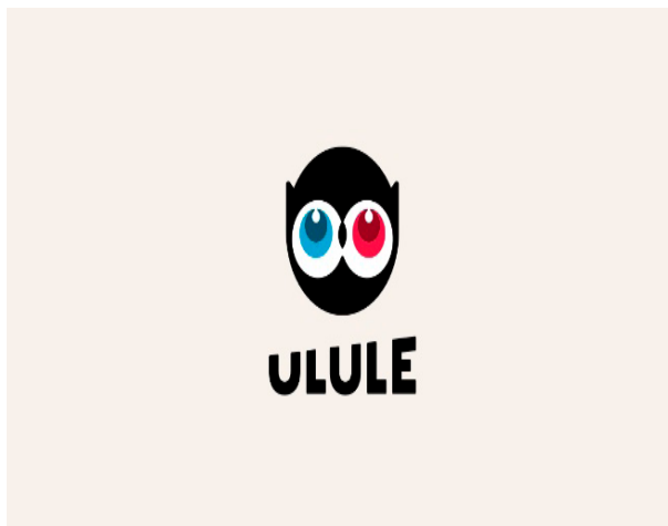
Figura 4. Ulule crowdfunding with a twist: success;

Referencia número 1 en Europa, Ulule supera los 100 millones de euros en los más de 24.000 proyectos financiados con una comunidad que engloba a más de 12 millones de personas. Allí podemos encontrar cientos de proyectos o iniciativas que se agrupan en 16 categorías y que incluyen tanto proyectos creativos como de ámbito social. Se cobra comisión sólo en el caso de que el proyecto sea exitoso y llegue a su objetivo de recaudación. Si el proyecto fracasa, no se cobrará ningún tipo de comisión.