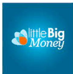
Figura 16. Littlebigmoney – para el desarrollo de proyectos con impacto positivo en las comunidades.