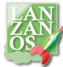
Figura 8. Crowdfunding Lanzasos

Además de encontrar socios o inversores para tu proyecto, se puede acceder a su formación y contar con el apoyo de sus expertos en desarrollo de proyectos. Una de las novedades que diferencian Lánzanos de otras plataformas de Crowdfunding es el hecho de que antes de pasar a la página de financiación tu proyecto tiene que reunir los votos suficientes (100 en total) para que pueda ser financiado.[11]