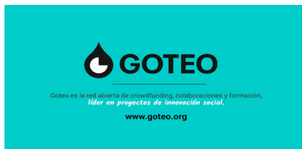
Figura 2. Goteo plataforma de crowdfunding cívico.

Condiciones: Todas las campañas de financiación colectiva publicadas en Goteo.org que consigan una recaudación igual o superior a su presupuesto mínimo definido están sujetas a un coste del 5% de la cantidad total del dinero recaudado en la campaña más impuestos, en concepto de mantenimiento del proyecto en la plataforma.