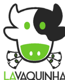
Figura 12. Lavaquinha – start-up Chile

El sitio Web no ofrece una rentabilidad esperada o garantizada por el aporte de los recursos. Los Usuarios declaran que, conforme la legislación financiera y penal del lugar en donde se encuentran los recursos objeto del aporte, éstos provienen de recursos propios, no tienen su origen en actividades ilícitas y no han sido entregados por terceros para el encubrimiento de actividades delictivas y por lo tanto, exoneran al Sitio Web y por consiguiente a su propietario de cualquier responsabilidad sobre la proveniencia de los fondos.