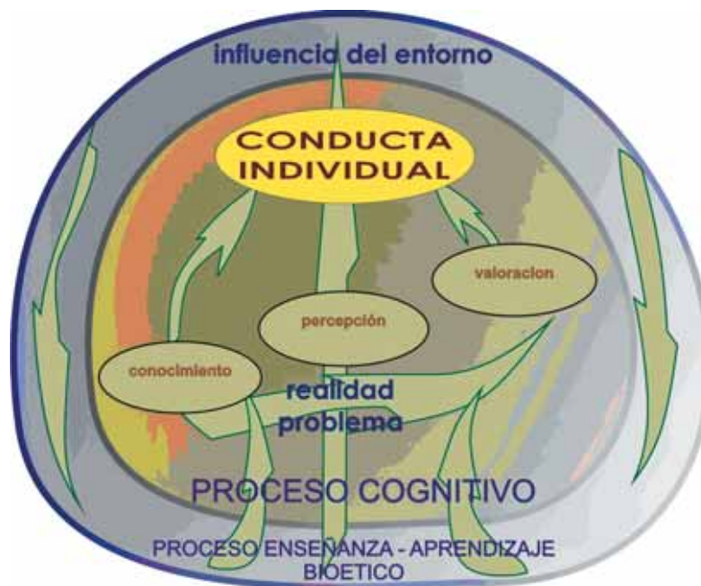
Figura No. 5. Relación entre el proceso cognitivo, la conducta y el proceso de enseñanza aprendizaje del individuo comunitario.

El proceso enseñanza aprendizaje que influye en la conducta del individuo desde el entorno enmarcado en la bioética mediante la observancia del principio de autonomía que el individuo tiene al asumir conscientemente el compromiso y aceptarlo de modificar su comportamiento es entonces la herramienta que se tiene para mejorar la satisfacción de las necesidades y lograr un comportamiento limpio.