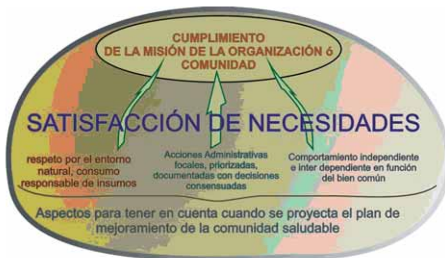
Figura No. 4. Sistema de acciones estratégicas para un comportamiento limpio de una comunidad.

Las experiencias acumuladas del grupo Choc Izone de la Universidad llevan a plantear el siguiente sistema de acciones estratégicas para orientar una comunidad hacia la satisfacción generalizada, limpia y autónoma de sus necesidades, esto es una Comunidad Saludable: